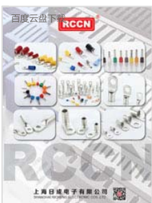
RCCN日成接线端子目录